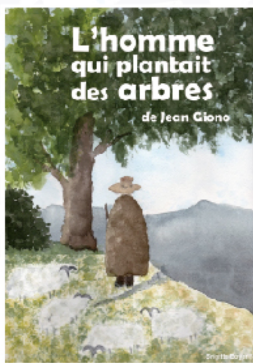
Affiche

Une rencontre entre un randonneur et un berger. Sur les hauts plateaux de Provence. Le berger, Elzéard Bouffier, vit chichement. Une trentaine de moutons. Région balayée par les vents. Désertique. Rares villages de misère. Galère humaine. Elzéard se fixe une mission. Redonner vie et espoir. Il plante des graines. Deviennent arbres. Il n'attend rien en retour. En l'espace de deux guerres, les arbres poussent. Les racines retiennent l'eau. Les habitants s'installent. La vie reprend son visage du plaisir. Renaissance des hameaux. Terre colorée. Chants d'oiseaux. Fable sur la nature. Pacifiste et humaniste. Don de soi. Générosité. Main tendue à l'autre. Geste d'amour. Comme ces arbres qui offrent leurs feuilles à l'humanité.