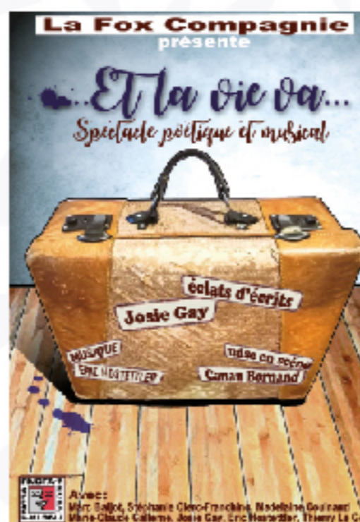
Affiche ©Charlie Gay

Six comédiens se piquent de curiosité pour une valise oubliée dans les coulisses d'un théâtre. Surpris de leur découverte, ils prennent aux mots ce qu'elle leur livre. Et les voilà beaux parleurs, chanteurs, danseurs, invitant le public à une fantasque balade poétique, inspirée de la plume de Josie Gay.