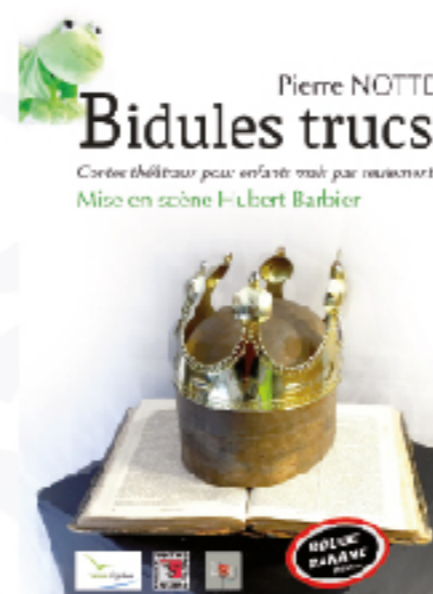
Affiche ©Coralie Argentin (www.loed-prod.net)

Huit pièces courtes mettent en scène d'étranges personnages mi-humains, mi-animaux : la Rose, la Zébrette, le Lion, la Girafe, une grenouille, etc... Évoquant tour à tour des thèmes aussi essentiels que l'amour, la mort, la fraternité, les retrouvailles. Ces contes théâtraux dessinent avec tendresse, humour mais aussi cruauté, un parcours menant le lecteur de l'enfance à l'adolescence.