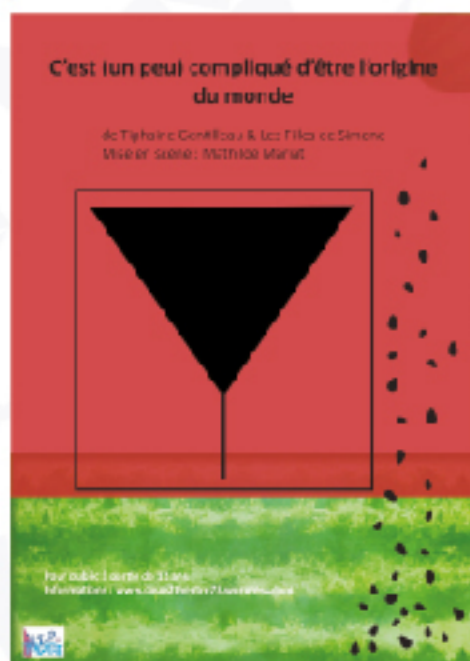
Affiche ©Jeromine Salvi

Avec humour et dérision, cette pièce dynamite les fantasmes de la maternité délicate et évoque les affres et les bonheurs d'un changement de vie définitif : devenir mère